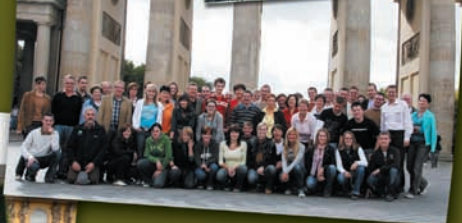
Die Neukirchner Musikfrauen vor dem Brandenburger-Tor

Die größte freitragende Halle der Welt ist mit ihren Ausmaßen (300m x 200 m und 107 m hoch) der größte Wasserpark Europas – das „Tropical Islands“ 60 km südlich von Berlin beeindruckte uns in jeder Hinsicht.