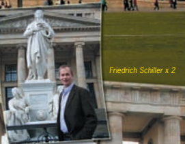
Friedrich Schiller x 2

Am Heimweg machten wir im berühmten „Auersbach-Keller“ in Leipzig Station und bekamen einen Eindruck von dieser aufstrebenden Stadt. In Nürnberg stärkten wir uns noch mit einer „Nürnberger Bratwurst-Jause“, ehe wir gegen Mitternacht heimkamen. 4 tolle Tage mit vielen Eindrücken, insgesamt rd. 2000 Kilometer und jede Menge Spaß – das waren die Zutaten einer gelungenen Musikreise 2007.