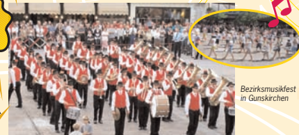
Bezirksmusikfest in Gunkskirchen