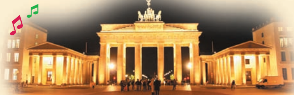
Berlins Hauptwahrzeichen, das „Brandenburger-Tor“

Ein ausgezeichnete Erfolg bei der Konzertwertung und sogar der „Bezirksieg“ mit der höchsten