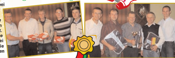
Die Schlagzeuger waren nicht zu schlagen

Besonders heiß her ging's diesmal bei unserer Register-Kegelmeisterschaft im Gasthaus Schwarzmüller. Die Kegeln hatten (meistens) keine Chance, es wurde im wahrsten Sinn des Wortes um jeden Kegel gefightet. Als strahlende Sieger sind erstmals die Schlagzeuger hervorgegangen. Bei den „Einzel-Siegern“ gewannen die „Old-Boys“ (eigentlich logisch, sie üben ja schon die meisten Jahre ;)