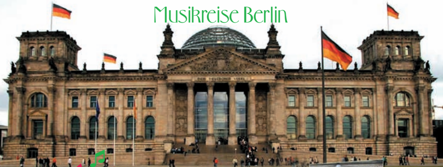
Der Berliner Reichstag – Sitz des deutschen Bundestages

Erstmals waren wir bei einer Musikreise insgesamt 4 Tage unterwegs – mit über 60 Teilnehmern brachen wir am 6. September 07 frühmorgens auf und machten zu Beginn Halt in Dresden. Bei einer Stadtführung sahen wir die Innenstadt mit all ihren Wahrzeichen, wie der Semperoper, dem Zwinger oder der wieder aufgebauten monumentalen Frauenkirche.