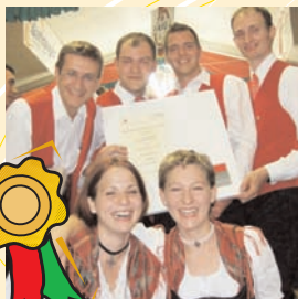
Strahlende Gesichter beim „Marschwertung-Bezirksieg“ in Günskirchen

Das heurige Musikjahr hat mit einer Resenerübrung für unseren Musikverein begonnen. Der 2. Platz von 481 oberösterreichischen Musikkapellen beim „00. Blasmusikpreis 2006“, der die Vielfalt der Leistungen eines Musikvereins bewertet, hat uns Musikerinnen und wie ich weiß sehr viele Freunde und Gönner unserer Musikkapelle sehr gefreut.