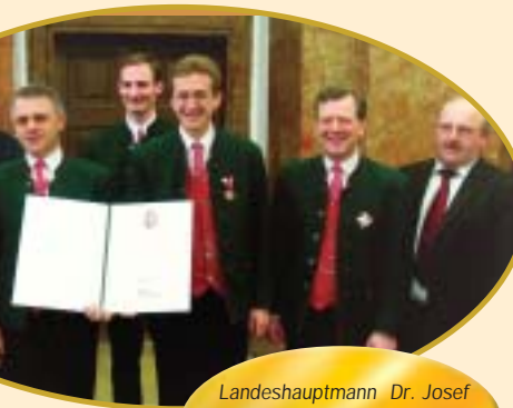
Landeshauptmann Dr. Josef Pühringer mit der Neukirchner Delegation beim Festakt im Landhaus.

Auch die Jüngsten machen ihre ersten musikalischen Schritte und haben ihr Können beim Vortragsabend der Instrumentalgruppe im Musikprobenheim unter Beweis gestellt. Freuen dürfen wir uns auch über die Erfolge von 7 MusikerInnen, die das JungmusikerLeistungsabzeichen erfolgreich abgelegt haben.