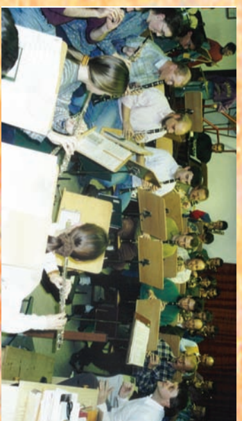
1993 Rede im alten Probetokal