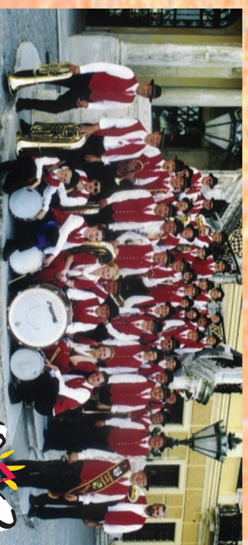
2000 WIEN vor dem Schloß Schönbrunn