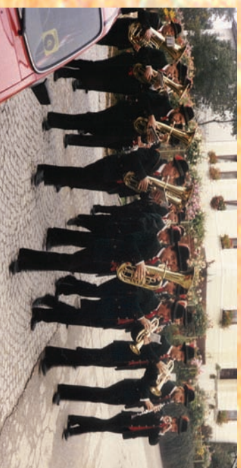
1984 Erstkommunion Aichkirchen