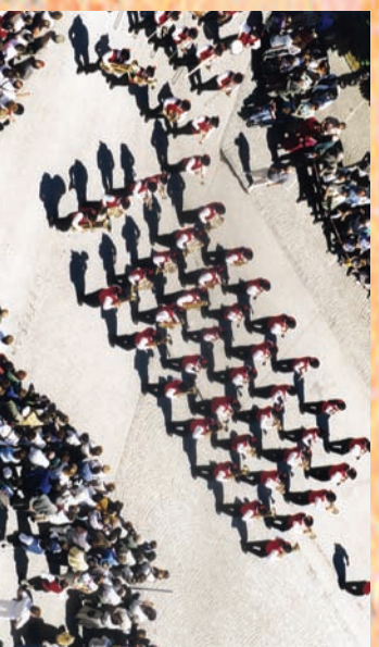
1999 Musikfest Sattler - exakte Reihen