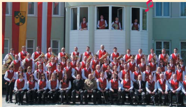
Am 9. März im Brucknerhaus - die TMK Neukirchen